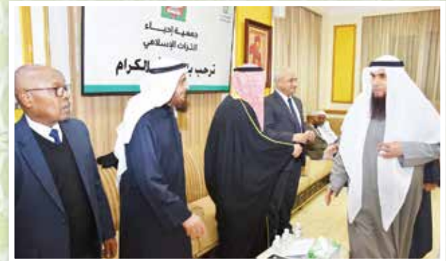
محافظ الفروانية والعيسى يستقبلان الضيوف

استعرض العيسى جهود قطاع التنمية الخيرية والمجتمعية؛ حيث نفذت الجمعية -من خلاله- العديد من المشاريع الدعوية التي انطلقت من دور الجمعية في نشر الوعي الديني بين أفراد المجتمع، والدعوة إلى الله -تعالى- بالحكمة والموعظة الحسنة؛ حيث