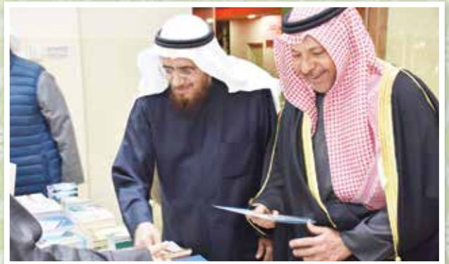
محافظ الفروانية والعيسى يستعرضان إصدارات الجمعية

وفي قطاع الإعلام والتدريب ذكر العيسى إنجازات القطاع وذكر منها: إصدار ٤٦ عددًا من مجلة الفرقان خلال العام ٢٠٢٤ تم من خلالها نشر العديد من المواضيع