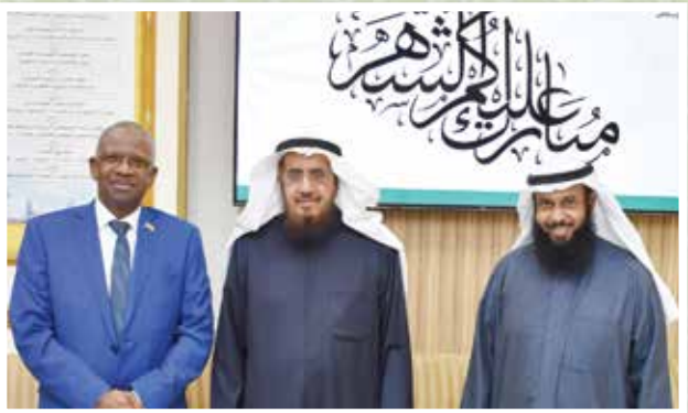
المسبح والعيسى وسفير جزر القمر

أقام قطاع العمل النسائي ١٥٤٨ نشاطاً دعويًا وتعليميًا ما بين درس علمي وحلقة قرآنية ومركز تحفيظ، ودورة علمية، ومسابقة ثقافية للأطفال والنساء.