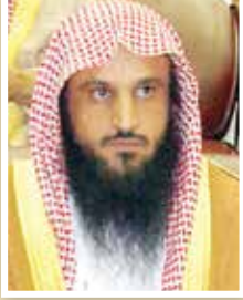
قال الشيخ عبد الرزاق عبدالمحسن البدن: الصيام مدرسة تربوية عظيمة

مباركة، يتخرّج فيها المؤمنون المتّقون، ويتزوّد فيها المؤمنون بأعظم زاد يمضي معهم في حياتهم كلّها، وفي أيامهم جميعها، على أنّ هذه المدرسة . مدرسة شهر الصيام . لا يستفيد منها كثير من النّاس؛ إذ تمضي عليهم هذه المدة الشريفة وهم يتعايشون معها تعايش الطالب البليد في مدرسته يتخرّج ولا يستفيد، بينما المؤمن المجتهد الحريص يدخل هذه المدرسة المباركة فيأخذ منها دروساً تربوية إيمانية علمية تمضي معه في حياته كلّها.