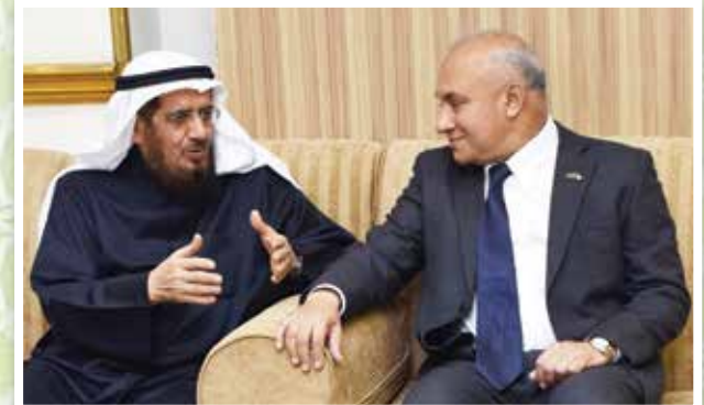
العيسى والسفير البنجلاديشي