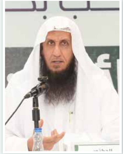
الشيخ د. محمد الحمود النجدي

● الوطنية أمر غير مستنكر شرعاً والسعادة والفرح بالعودة للوطن ليس بمحرّم وكذلك الحزن والكآبة لفراقه بل كلها مشاعر إنسانية لا اعتراض عليها