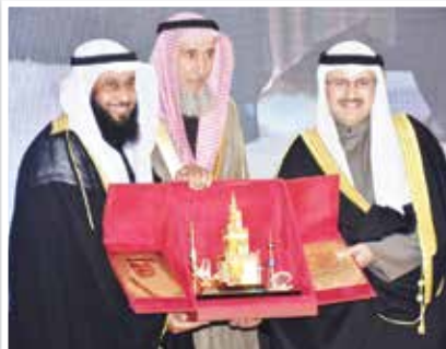
الشيخ ناظم المسباح والشيخ جاسم يكرمان معالي الوزير