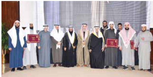
تكريم الحفاظ المجازين بالقراءات