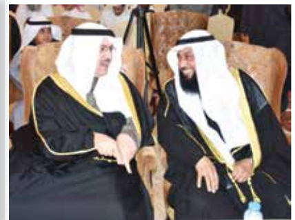
المسباح ومعالي الوزير