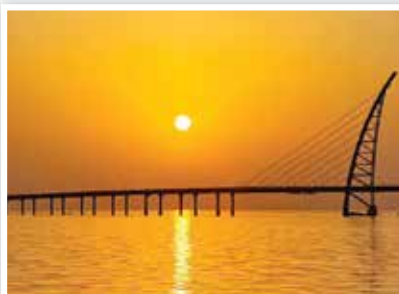
الصورة الفائزة في مسابقة التصوير