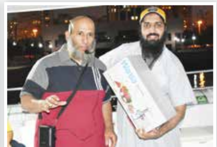
الطاهري الفائز بمسابقة أفضل صورة