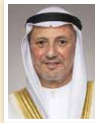
وزير الخارجية الكويتي

سلطات الاحتلال الاستفزازية، ولا سيما الانتهاكات المستمرة لحرمة المسجد الأقصى المبارك، وسياسة التوسع الاستيطاني، كما أكدت موقف دولة الكويت الثابت والمبدئي في الوقوف إلى جانب الشعب الفلسطيني الشقيق