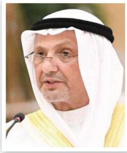
الشيخ سالم عبدالله الجابر الصباح

ثم بين وزير الخارجية أنهم حاولوا إنزال طائرة الإخلاء في منطقة (هتاي) حيث يوجد مجموعة من الكويتيين وتم إبلاغنا أن المطار فيه دمار ولا تستطيع الطائرة النزول فيه وحوّلنا