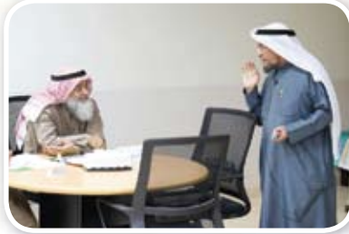
٩ دورة: مهارات التواصل الفعال والتعامل مع الآخرين