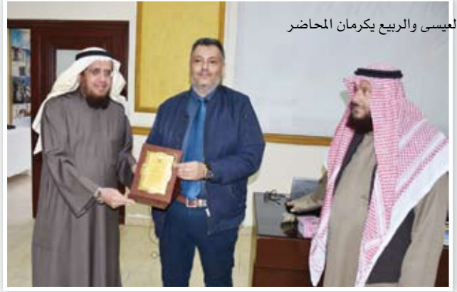
العيسى والربيع بكرمان المحاضر