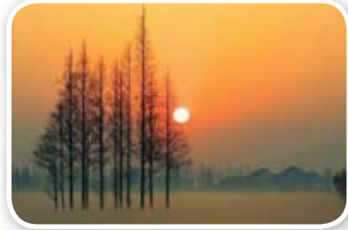
٤٢ من عفة النساء غض أبصارهن