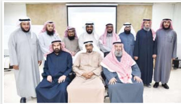
صورة جماعية للمشاركين في الدورة

العمل كله. مرحلة الإنهاء: وهي المرحلة التي بنجح فيها الفريق في تحقيق الهدف المنشود منه، وحينها ينتهي الفريق بانتهاء غرضه، أو يمكن استثمار جهوده في البدء بهدف جديد والعمل على تحقيقه، لكن هذه المرة سيكون الأمر أسهل، وهذا يرجع لتكوين فريق يؤمن، وقادر على العمل الجماعي بالفعل.