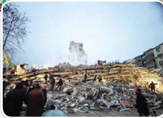
١٢ زلزال تركيا وسوريا يُخلف الآلاف من الضحايا والجرحى